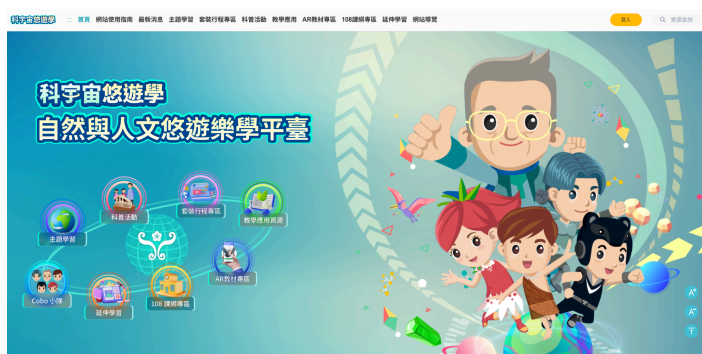
▲「科宇宙悠遊學」自然與人文悠遊樂學平臺

本平臺以既有數位學習資源為基礎，整合自然科學與人文領域內容，並串聯教育部因材網，提供教師於課堂教學與校外學習中運用之數位教材。透過線上學習資源與實體場域之結合，發展跨虛實之自主探索學習模式，引導學生進行觀察、探究與統整跨學科知識，拓展多元學習視野，提升學習深度與應用能力。