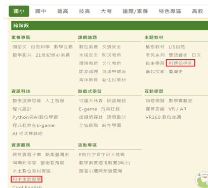
▲因材網—科博館探究