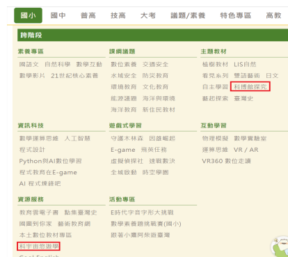
▲因材網—科博館探究