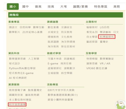
▲因材網—科博館探究